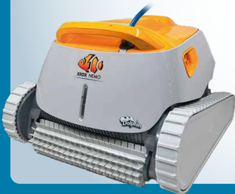
XEOX Xeox Nemo

WAND- | BODENSAUGER | WASSERLINIENSAUGER K: 06021