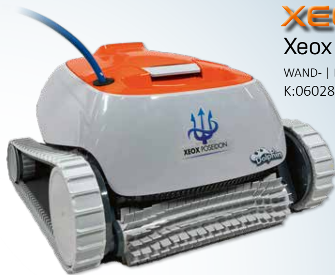
XEOX Xeox Poseidon WAND- | BODENSAUGER K:06028

Nach der ersten Badesaison bieten wir dir ein kostenloses Winterservice für deinen XEOX Poolsauger an, um sicherzustellen, dass dein Poolsauger einwandfrei funktioniert und bereit für die nächste Saison ist.